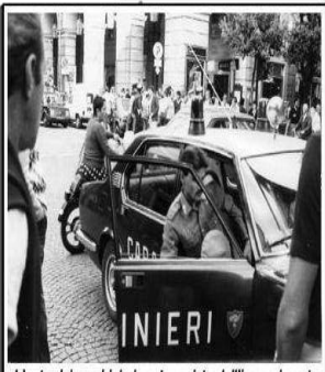
L'auto dei carabinieri protagonista dell'inseguimento