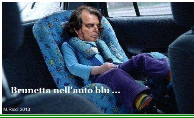
Brunetta nell'auto blu ...