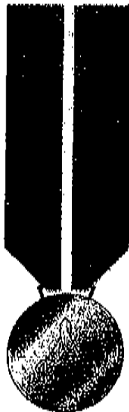
Medaglia in bronzo dorato del diametro di mm 35, spessore mm 3 appesa ad un nastro di seta blu largo mm 37, caricato al centro di un dato iniziatore largo mm 9