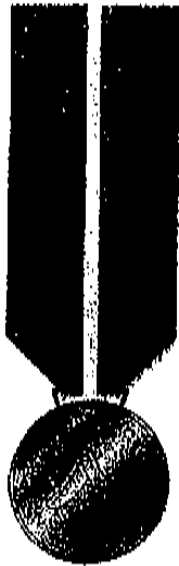
Medaglia in bronzo del diametro di mm 35, spessore mm 3, appesa ad un nastro di seta blu largo mm 37, caricato al centro da un palo bicolor largo mm 9