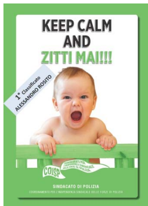
1° classificato (ALESSANDRO ROSITO)