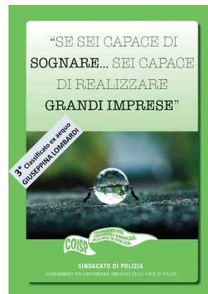
3° classificato ex aequo (GIUSEPPINA LOMBARDI)