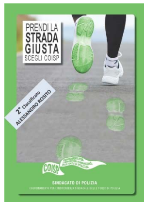
2° classificato (ALESSANDRO ROSITO)