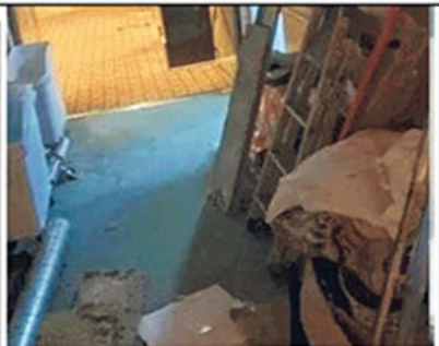
▲ A bordo Un'immagine che documenta le condizioni della Mykonos Magic

E se torna la possibilità di fare il bagno fra Capotò e Torre Canne, in un primo momento vietata da un'ordinanza della Guardia costiera di Monopoli, la nave sarà ancora sotto i riflettori. Perché a quanto pare sarebbe stata in ristrutturazione e, evidentemente, non era pronta per accogliere tutto il personale in divisa. Immediatamente le reazioni dei vari sindacati di categoria: «Non ci sono parole per descrivere la surreale e vergognosa situazione che hanno trovato molti colleghi di tutte le forze di polizia, aggregati per