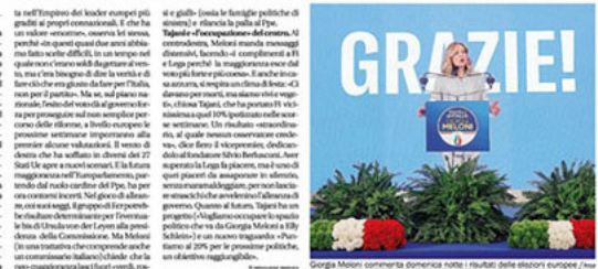
Giorgia Meloni commenta l'elezione di Napolitano...