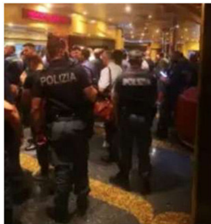
LA NAVE CHE OSPITA LE FORZE DELL'ORDINE PER IL G7 A BRINDISI

Responsabile politico della Uil Comparto Difesa e Sicurezza - Non è tollerabile trattare in questo modo donne e uomini che rischiano la propria vita per garantire la sicurezza del Paese. Rivolgo un appello ai vertici del Viminale affinché intervengano rapidamente per porre fine a questa vergogna e adottino le necessarie misure correttive nel rispetto della dignità e del decoro del personale delle Forze dell’ordine”. [...]