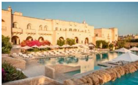
BORGO EGNAZIA A SAVELLETRI 5