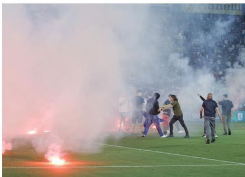
Brescia-Cosenza: disordini, invasione di campo e 8 poliziotti feriti