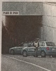
SICUREZZA Agenti della Polizia di Stato durante alcuni servizi di controllo del territorio

Altro esempio: «Pordenone, Cordenons e Porcia contano circa 85mila residenti e avrebbero bisogno della presenza di almeno tre pattuglie. Ma con affanno si riesce a garantire l'uscita di due Volanti per turno, solo a pieno organico, e spesso devono rilevare incidenti stradali», lasciando da parte «prevenzione e repressione dei reati. Una cronica e sofferta condizione che potrebbe migliorare se la Polizia municipale effettuasse turni di 24 ore». Senza dimenticare le attività investigative che impegnano l'organico. «Una situazione - concludono i sindacati - che evidenzia una sempre maggiore difficoltà per la Polizia di Stato di svolgere al meglio le proprie attività. Ed è un tema che riguarda il diritto alla sicurezza di ogni cittadino».