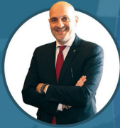
Emanuele Prisco Sottosegretario di Stato al Ministero dell'Interno