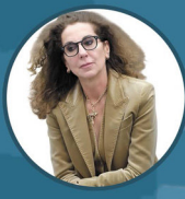
Wanda Ferro Sottosegretario di Stato al Ministero dell'Interno