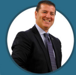
Domenico Pianese Segretario Generale Sindacato di Polizia COISP