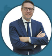
Nicola Molteni Sottosegretario di Stato al Ministero dell'Interno