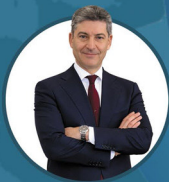
Vittorio Pisani Capo della Polizia - Direttore Generale della P.S.