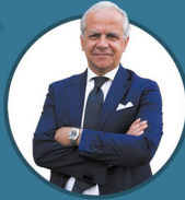
Matteo Piantedosi Ministro dell'Interno