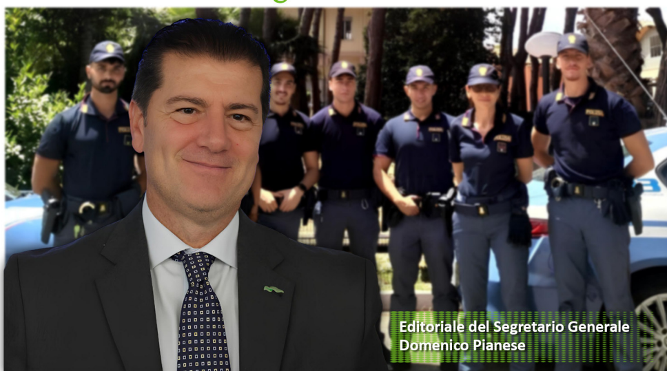
Editoriale del Segretario Generale Domenico Pianese

Essere Poliziotti in questi anni è sempre più complesso. Da una parte, la stragrande maggioranza dei cittadini italiani ci amano e rispettano perché riconoscono l'importanza del nostro ruolo e sanno di potersi affidare a noi nei momenti di maggiore difficoltà. Dall'altra, una minoranza agguerrita cerca di destabilizzare l'ordine pubblico e di aggredire le forze di polizia, causando negli ultimi due anni più di 800 Poliziotti feriti, un numero inaccettabile!