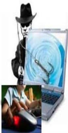
I "nuovi pescatori" del web