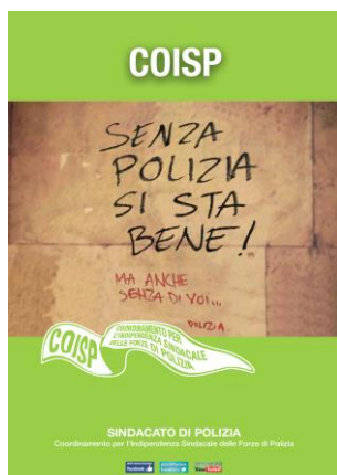
2° classificato (MATTEO ZAMENGO)