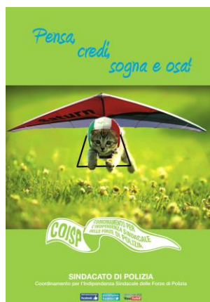
3° classificato (PATRIZIA BOLOGNANI)