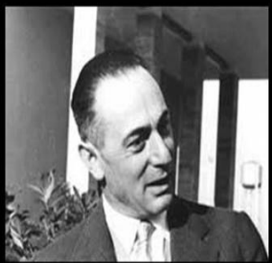
MI CHIAMAVO MATTEI